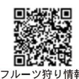
フルーツ狩り情報

お問い合わせ 深川観光案内所 (JR 深川駅舎内) TEL 0164-34-5581 10:00 ~ 17:00 年中無休 (年末年始除く) 道の駅ライスランドふかがわ TEL 0164-26-3636 9:00 ~ 19:00 年中無休 (年末年始除く) 深川市果樹協会 (深川市農政課) TEL 0164-26-2255 2019年6月現在