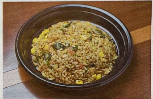
旨辛チャーハン 920円