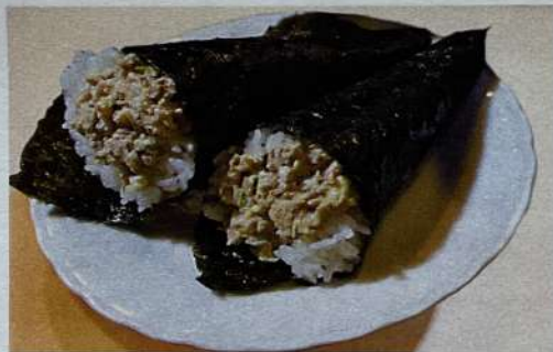
チャーマヨ手巻き 480円