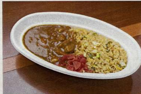
チャーハンカレー 980円