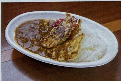
ギョーザカレー 980円

ライス大盛プラス100円 ご用意にお時間がかかりますので、 店員までお声掛けください。 電話にてご予約も承ります。 受付専用☎ 080-8295-7024 (受付時間/10:00~19:00)