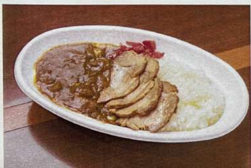
チャーシューカレー 980円