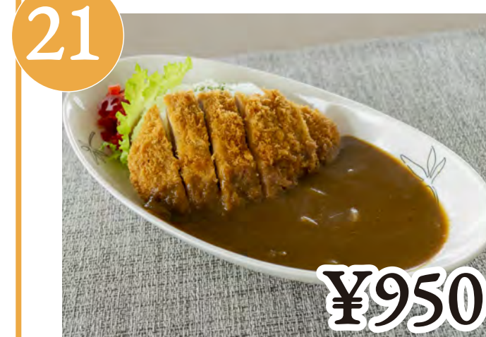
21 かつカレー Deep-Fried Pork Cutlet Curry