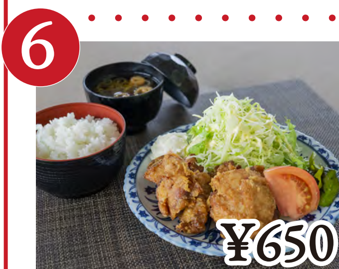
6 からあげ定食 Japanese Fried Chicken Platter