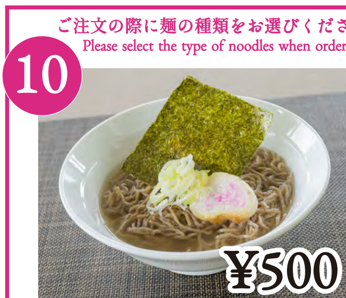
10 黒米塩ラーメン Black Rice-Solt Flavoured Ramen