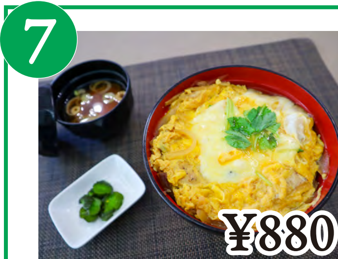
7 炙り鶏のチー玉親子丼 Oyakodon(Chicken and egg Rice Bowl)