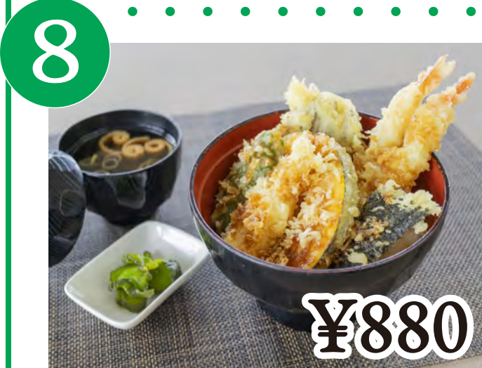
8 天丼 Japanese Tempura Rice Bowl