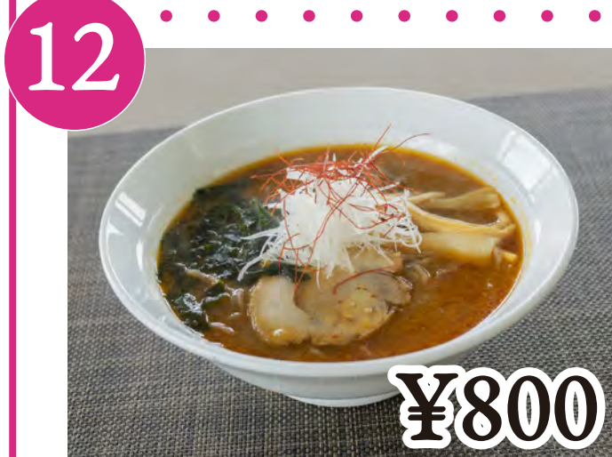
12 黒米辛味噌ラーメン Black Rice-Spicy Miso Ramen