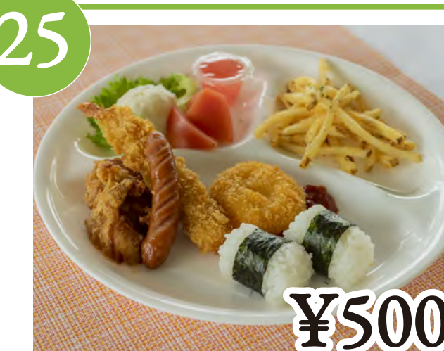
25 お子様ランチ Kids Meal

※写真はトマトバーガーです This photo is Tomato Burger.