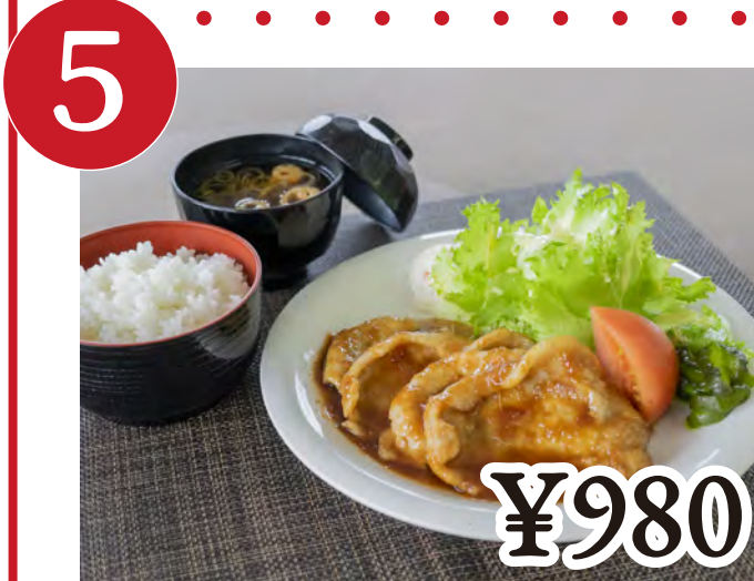
5 生姜焼き定食 Ginger Pork Stir-Fry Platter