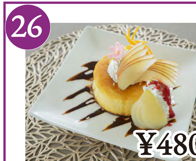
26 パンケーキ Pancake

Please tell staff which menu would you like to have at the ordering counter.