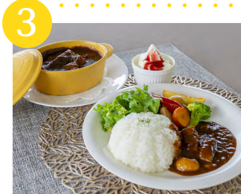
3 豚肉と豆のシードル煮込み Pork and Beans Simmered in Cidre