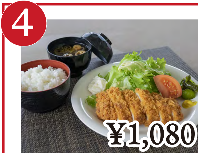
4 どんかつ定食 Tonkatsu Platter