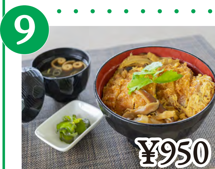
9 かつ丼 Deep-Fried Pork Cutlet Rice Bowl