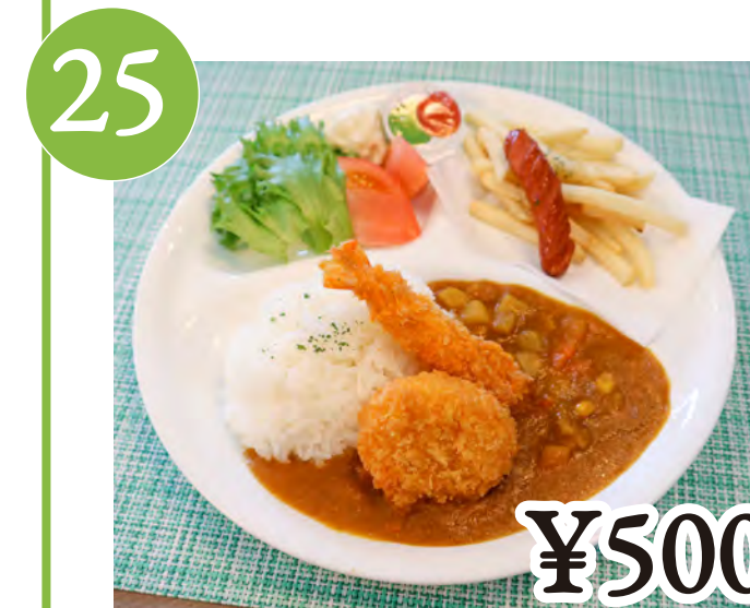
25 お子様カレー Kids Curry