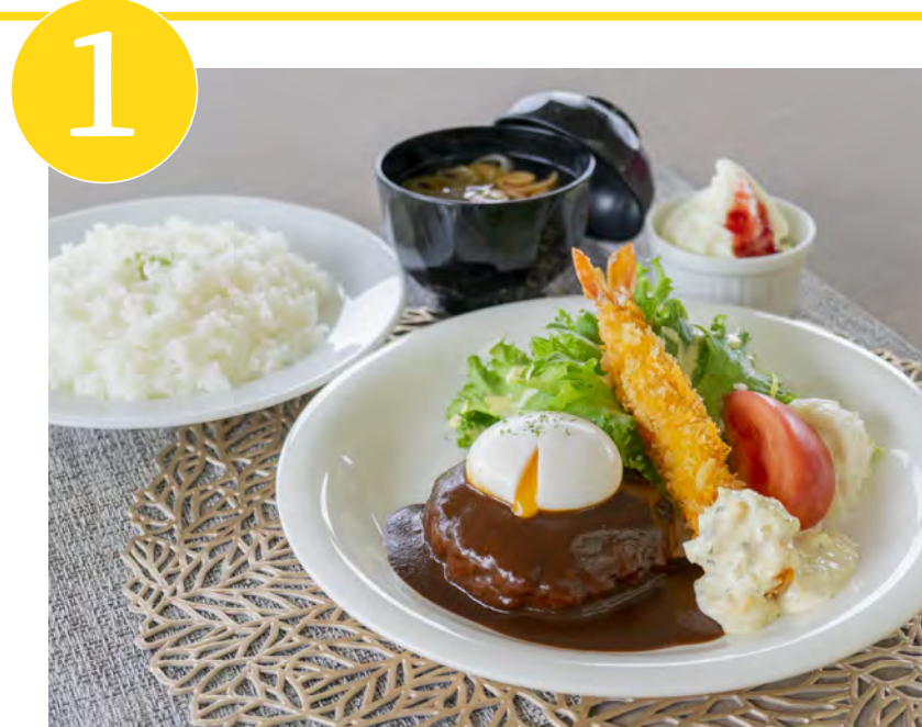
1 深川牛ハンバーグステーキ 海老フライ添え Fukagawa Beef Hamburg Steak with Fried Shrimp