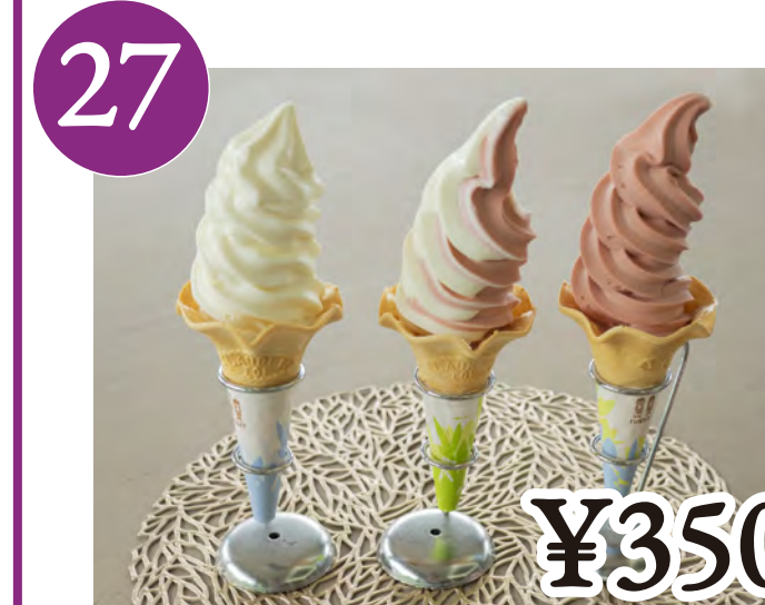
27 ソフトクリーム Soft Serve