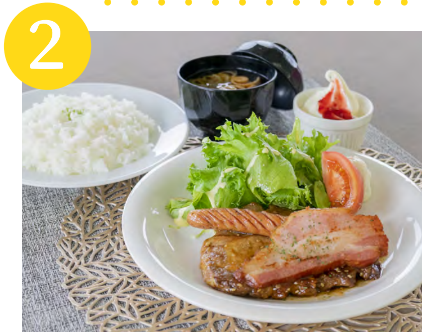
2 深川ポークのトンテキ ウインナー・ベーコン添え Fukagawa Pork Steak with Wiener and Bacon