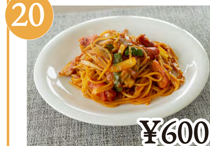
20 ナポリタン "Naporitan" - Ketchup-Based Spaghetti