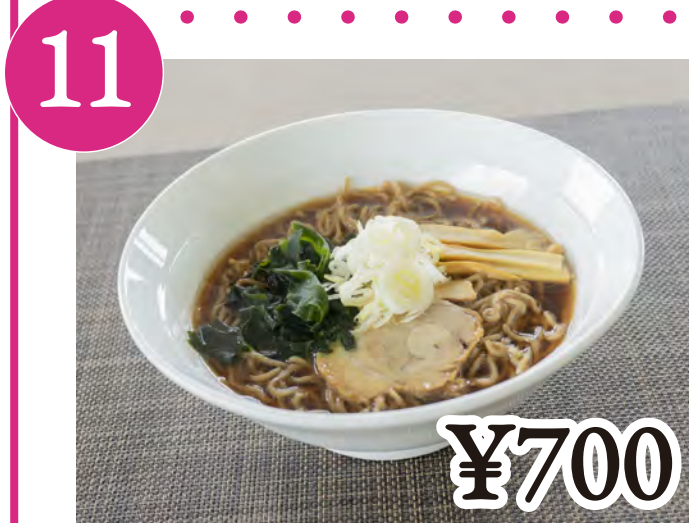
11 黒米しょうゆラーメン Black Rice-Shoyu Ramen