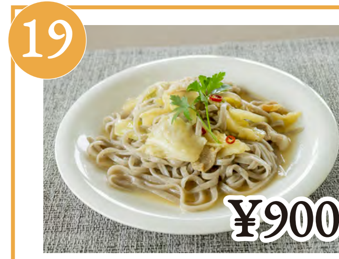
19 季節の野菜と豚肉の 黒米もちもちパスタ Vegetable in Season, Pork and Black Rice Pasta that Has a Soft and Elastic Texture