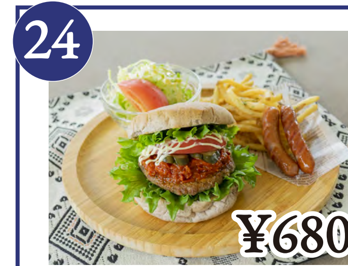
24 黒米バーガーセット Black Rice Burger Set